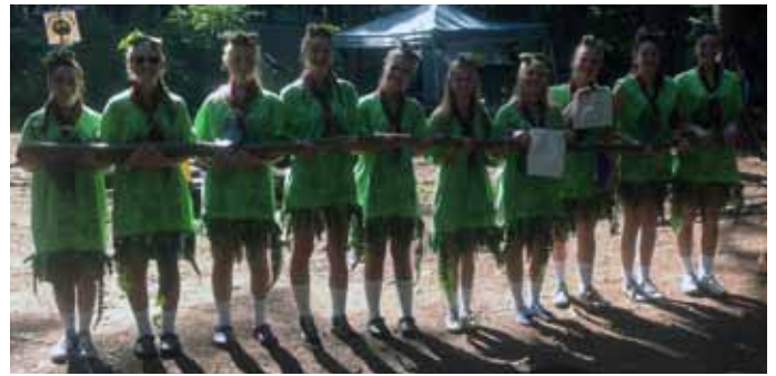
Vyr. Skautės stato vartus. (Įdomios kandidačių kostiumai.) Vyr. Skautės construct gates. (Interesting kandidačių costumes.)