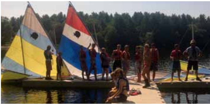
Prit. Skautai išbando savo buriavimo jėgas. Prit. Skautai try their hand at sailing.