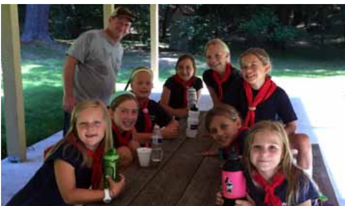
Paukštytės užtruksa keletą minučių pailsėti. Bet ne ilgam! Paukštytės take a few minutes to relax. But not for long!