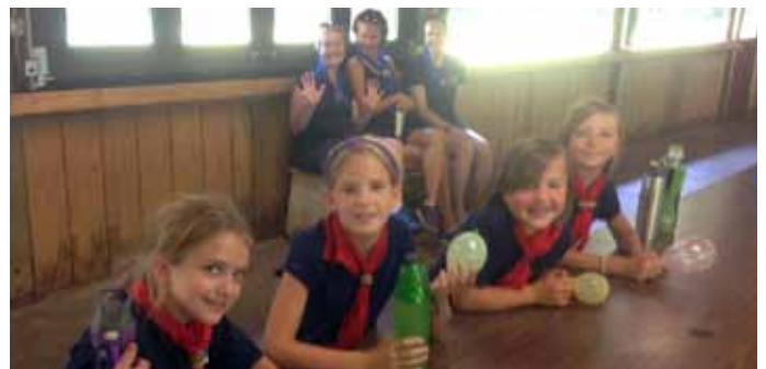
Oi, kaip smagu pirmą dieną stovykloje! How much fun we're having on the first day of camp!