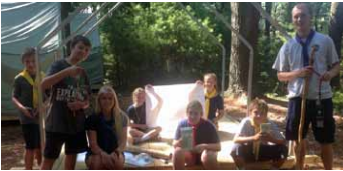
Įdomios orientavimo ir išskylavimo pamokos. Interesting orienteering and hiking lessons.