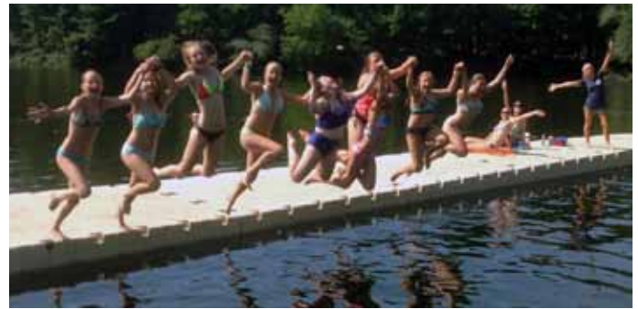
Prit. Skautės išlaikė savo plaukimo egzaminus, valio! Prit. Skautės just passed their swim test, hooray!