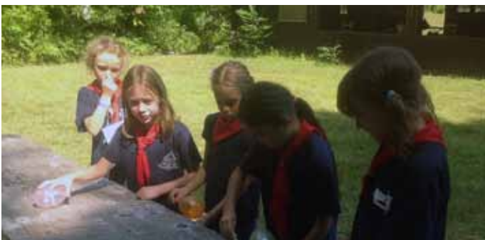
Šautuvai yra įdomus, bet saugumas yra pagrindinis! Shooting a rifle is fun, but safety first!